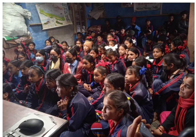
सामाजिक जनजीवनका प्रत्येक क्षेत्रमा किशोरी तथा महिलाहरूको समतामूलक सहभागिता आवश्यक छ

खानेपानी, सरसफाइ र स्वच्छता व्यवस्थापनमा लैंगिक तथा सामाजिक मूलप्रवाहीकरणको मान्यतालाई सन् १९८२ अप्रिलमा सम्पन्न संयुक्त राष्ट्र संघको नवौँ महासभाले पहिलो पटक आत्मसात गरेको थियो । जसले महिलाहरूको भूमिकालाई खानेपानी तथा सरसफाइमा महत्वपूर्ण स्थान दिनु पर्छ भन्ने विषयमा निर्णय गर्‍यो । सो विषय बमोजिम सन् १९८० मा कोपनहेगनमा सम्पन्न संयुक्त राष्ट्र संघको मध्यदशक सम्मेलनमा सबै सरकारी र गैर सरकारी संघ संस्थाहरूले महिलाहरूको खानेपानी परियोजनाका सम्पूर्ण चरणहरूमा अर्थपूर्ण सहभागिता सुनिश्चित गराउन सहमति गरे बमोजिम कार्यान्वयनमा आएको थियो (Regmi, 2022) । त्यसपछि पनि संयुक्त राष्ट्र संघका विभिन्न बैठकहरूमा महिलाहरूको सहभागिताका विषयमा पटकपटक छलफल भए । सन् १९९२ मा आयरल्याण्डको राजधानी डब्लिनमा सम्पन्न पानी र वातावरण सम्बन्धी अन्तर्राष्ट्रिय सम्मेलनमा पानी, महिला र गरिबी सम्बन्धी विषय र आर्थिक पक्षमा केन्द्रित भएर छलफल भयो । उक्त सम्मेलनबाट चार वटा मुख्य सिद्धान्तहरू प्रतिपादन भए, जो आजसम्म पनि डब्लिन सिद्धान्तका रूपमा सान्दर्भिक छन् । उक्त सिद्धान्तहरूमा विशेषगरी पानीको योजना, व्यवस्थापन, र सुरक्षामा महिलाहरूले मुख्य भूमिका खेल्न सक्छन् भन्ने विषयलाई उजागर गरिएको छ । सन् १९९२मा नै रियो द जेनेरियोमा सम्पन्न संयुक्त राष्ट्र संघको वातावरण र विकास सम्बन्धी अन्तर्राष्ट्रिय सम्मेलनले तय गरेका छलफलका २१ वटा विषयहरूमध्ये सात वटा विषयहरू त पानी