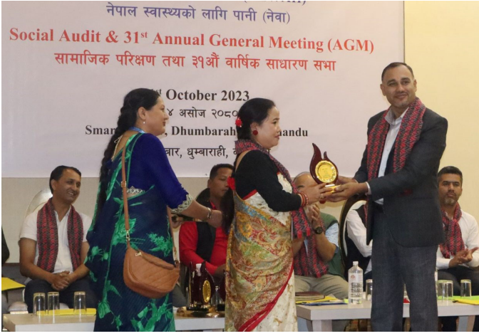
नेवाका उत्कृष्ट कर्मचारीहरूलाई सम्मानित गरिदै

गाउँपालिकाका दाजुभाइ दिदी बहिनीहरूको मुहार आज हँसिलो देख्दा आफूलाई समेत सन्तुष्टि मिलेको बताउनुभयो ।