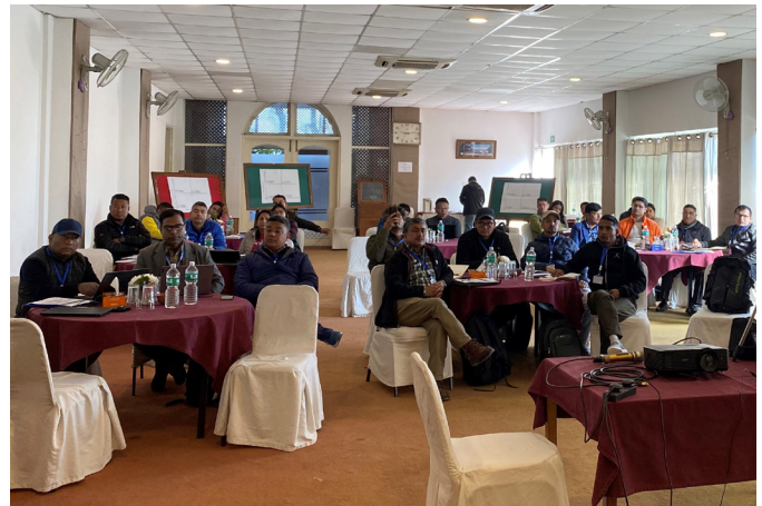
तालिमको एक झलक

दिगो खानेपानी, सरसफाइ तथा स्वच्छता सेवाहरू प्रदान गर्ने सरकारी, गैरसरकारी तथा निजी संस्थाहरू बीचको सम्बन्ध एक महत्वपूर्ण आधार स्तम्भ भएकाले संघीय, प्रादेशिक र स्थानीय सरकार, सेवा प्रदायकहरू, नियामकहरू, निजी उद्दमीहरू र उपभोक्ता समितिहरू बीच सन्तुलित सम्बन्ध कायम गर्दै दिइने सेवाले मात्र वास प्रणालीको सुदृढीकरण हुन सक्ने कुरालाई तालिममा औल्याइएको थियो।