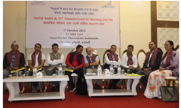
साधारण सभामा आमन्त्रित पाहुना तथा विशिष्ट व्यक्तिहरू