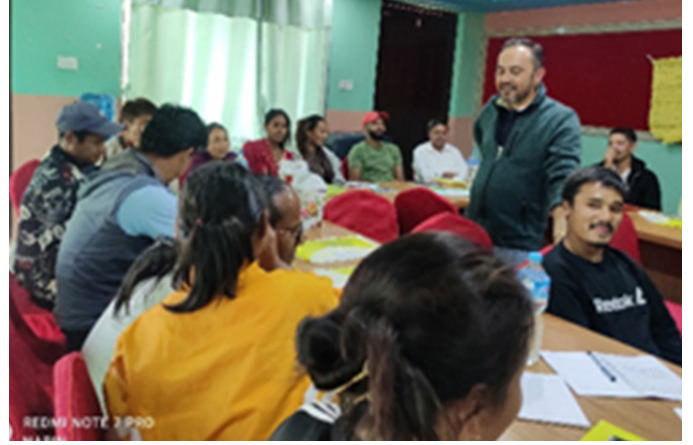
सिन्धुलीमा सञ्चालित तालिमका सहभागीहरू

नेवाले आयोजनाको सम्पूर्ण व्यवस्थापन तथा प्राविधिक निरिक्षणका लागि एक जना प्राविधिक कर्मचारी, स्वच्छता तथा सरसफाइ