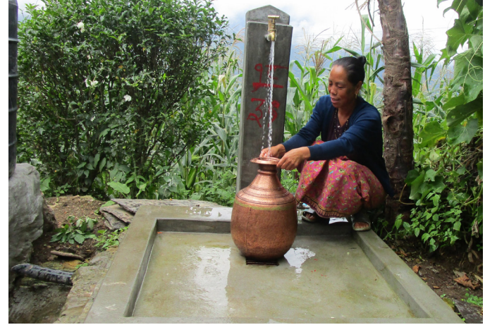
भेडीखर्कका घर घरमा बनेका धारा

यसरी कुनै बेला पानी पैचो समेत नपाइने भेडीखर्क गाउँको ठूलो दुःख आज पानीले धोइदिएको छ।