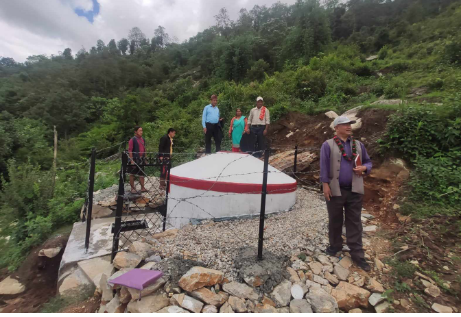
गाउँको शिरानमा रहेको पानी वितरण गर्ने ट्याङ्की