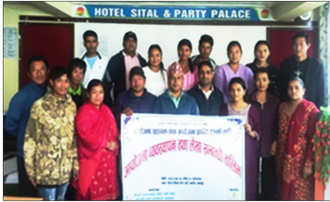
बागलुङमा सञ्चालित तालिमका सहभागीहरू

प्रवर्द्धनका लागि एक जना वरिष्ठ स्वच्छता तथा सरसफाइ सहजकर्ता खटाउने गर्दछ । यसैगरी स्थानीय स्तरमा समन्वयका साथै नेवाबाट उपभोक्ता समितिलाई प्रदान गरिने तथा पालिकाबाट प्राप्त हुने साभेदारी रकमको हिसाब किताब राखी समयमै प्रतिवेदन तयार गरी नेवा तथा पालिकामा पेश गर्नका लागि एकजना स्थानीय कर्मचारी पनि छनोट गरिन्छ । आयोजना सहायकलाई सम्बन्धित वडाले र आयोजना प्रवर्द्धकलाई उपभोक्ता समितिले छनोट गर्दछ भने कामको जिम्मेवारी अनुसार उनीहरूको पारिश्रमिक पनि फरक फरक हुन्छ । नेवाले सञ्चालन गरेको तालिम पनि यसरी छनोट भएका कर्मचारीहरूको आयोजना व्यवस्थापन सम्बन्धी सीप अभिवृद्धि गर्ने उद्देश्यका साथ सञ्चालन गरिएको हो ।